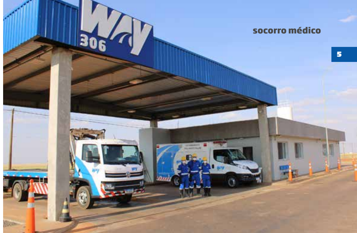
Equipe e viatura de APH posicionados em base operacional

São 3 ambulâncias do tipo C, viaturas mistas de resgate e primeiros socorros, equipadas para atendimento de emergências pré-hospitalares que conta com equipamentos médicos para a manutenção das vias aéreas, controle de sangramento, imobilização e remoção da vítima e desfibrilador automático; além de ferramentas especiais para retirada de vítimas presas nas ferragens, extintores, alavancas, entre outros.