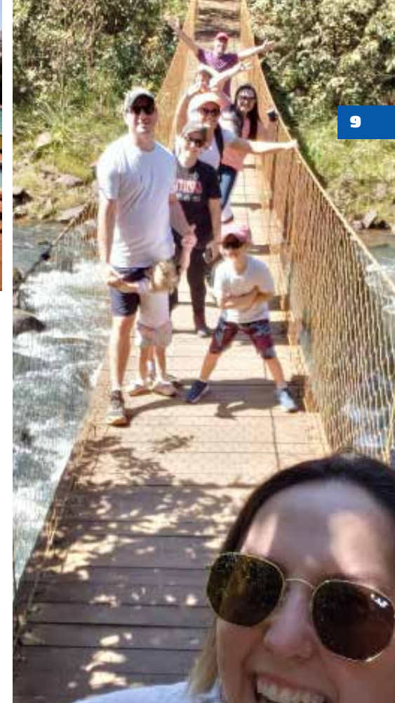
Selfie na ponte pênsil: visão privilegiada da natureza

A infraestrutura do parque é excelente, com estacionamento, restaurante, banheiros, vestiários, quadra de vôlei de areia e futebol. Dá pra passar o dia todo!