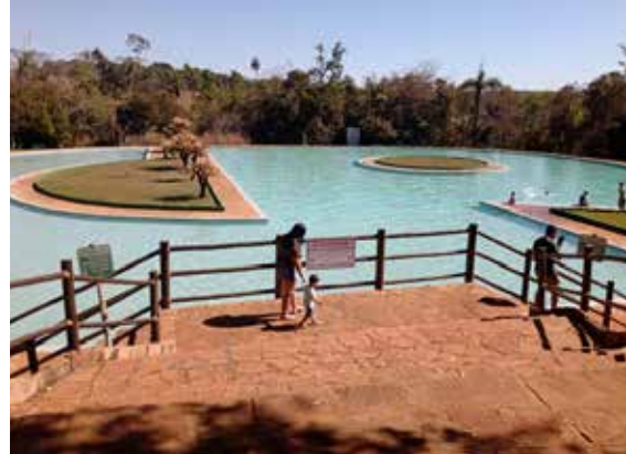
Piscina de água das nascentes: opção pra toda família

Para quem gosta dos esportes radicais, o parque ofere-