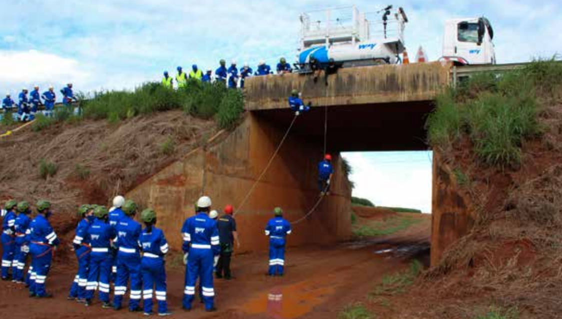
Equipes em treinamento de resgate em altura na rodovia

A vida deles é assim: sempre alertas e prontos para prestar o melhor atendimento às vítimas em situação de emergência na MS-306. A equipe de APH (Atendimento Pré-Hospitalar) da Concessionária Way-306 é treinada para socorrer pessoas e salvar o que temos de mais precioso: a vida!