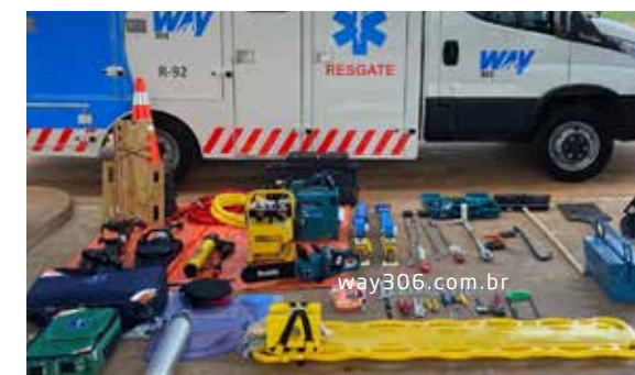
Equipamentos e ferramentas disponíveis nas ambulâncias tipo C

Nesse trabalho são seguidos rigorosamente os protocolos médicos internacionais e os parâmetros de tempo de atendimento estabelecidos no contrato de concessão. Agilidade e precisão no primeiro atendimento médico em acidentes são fundamentais para estabilizar o quadro de saúde da vítima e removê-la da forma correta para o hospital mais próximo e em condições de recebê-la, reduzindo o risco de morte ou de futuras sequelas.