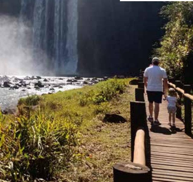
Salto do Majestoso: 64 metros de queda d'água