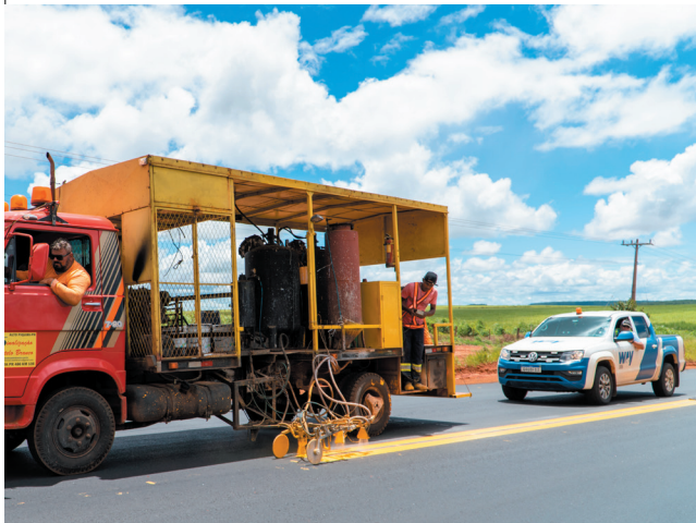
Pintura de faixa: sinalização revigorada

Os trabalhos de conservação, manutenção e sinalização da MS-306, realizados diariamente pela Way-306, são fundamentais para manter a infraestrutura, preservar as boas condições em toda a faixa de domínio e aumentar o conforto e a segurança dos motoristas, pedestres e comunidades lindeiras que utilizam a rodovia.