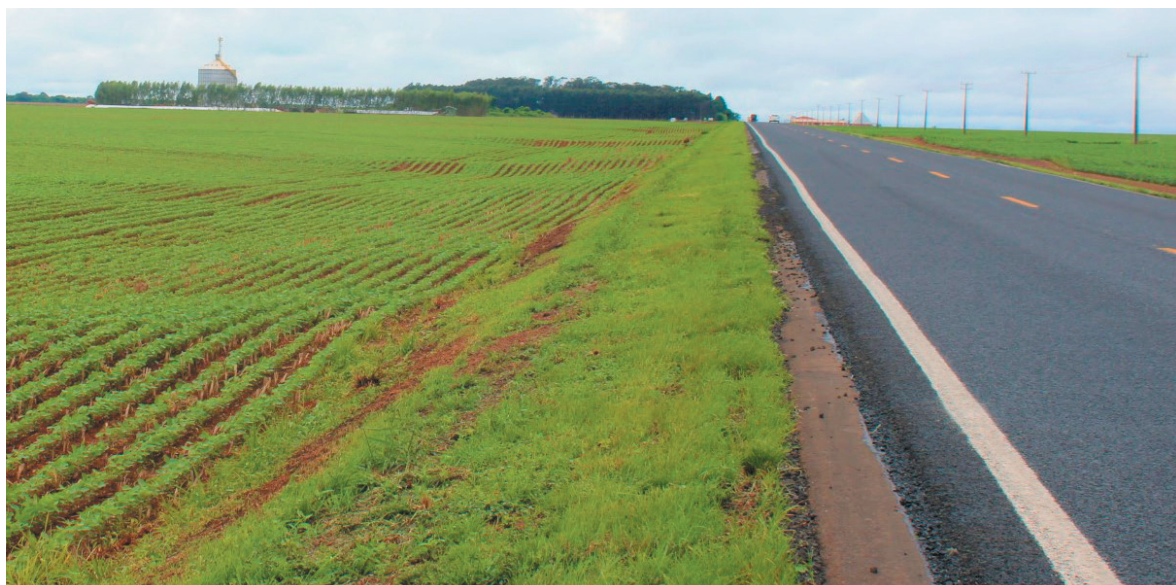
Parte da soja plantada às margens da rodovia poderá ser doada pelos produtores em benefício de entidades filantrópicas das comunidades municipais

O produtor que aderir ao projeto irá se comprometer a fazer a doação diretamente à entidade escolhida dentre uma lista pré-estabelecida, de acordo com a necessidade da entidade. A doação poderá ser em verba, bens adquiridos