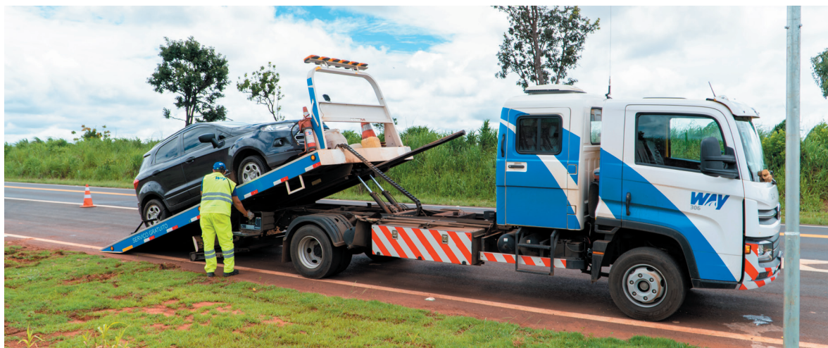
Socorro com guincho leve: remoção para área segura em emergências

» Balanco do Centro de Controle Operacional da concessionária revela números expressivos de atendimentos aos usuários no primeiro ano de Operação de Tráfego