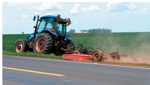
Roçada mecânica na faixa de domínio