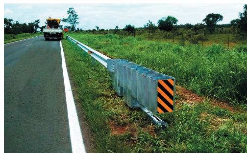
Implantação de defensas metálicas

Ações rotineiras contribuem para viagens mais confortáveis e seguras