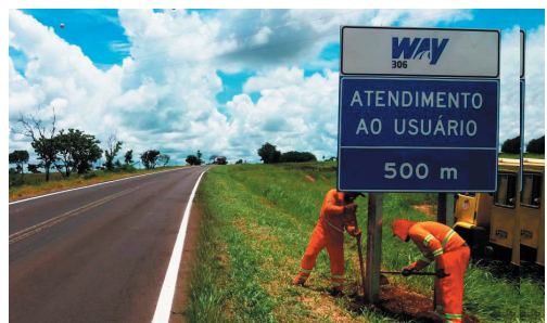
Sinalização vertical: placa indicativa de base way306.com.br