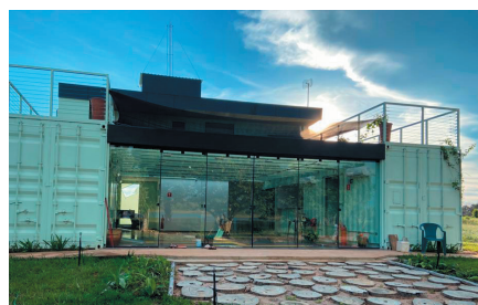
Centro de visitantes: infraestrutura adequada para receber turistas

e-mail: imasulcostarica@imasul.ms.gov.br