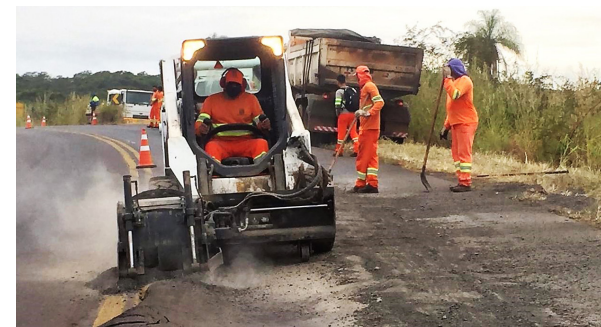
Fresagem e recuperação do pavimento em ponto crítico