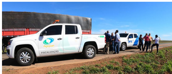
Agepan vistoria trecho da MS-306 sob concessão da Way-306

Way-306 tem avaliação positiva da Agepan após dois meses de serviços