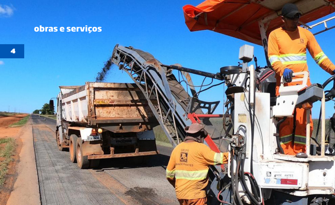
Recuperação inicial do pavimento: mais segurança, economia e fluidez no trânsito