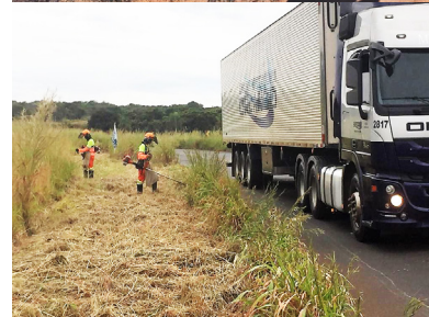
Operação tapa-buracos, roçada da vegetação e marcos quilométricos: melhorias em andamento na MS-306